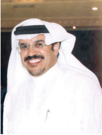
سعد بن سعيد الزهري

أمين عام الاتحاد العربي للمكتبات والمعلومات