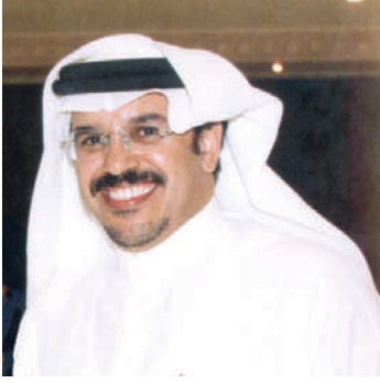
سعد بن سعيد الزهري أمين عام الاتحاد العربي للمكتبات والمعلومات